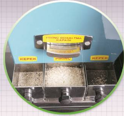
ÇELTİK RANDİMAN MAKİNESİ / PADDY QUALITY TEST MACHINE CRM 125-2T